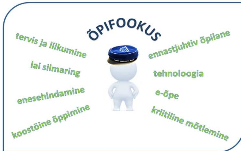
Joonis 2. Õpifookuse peamised märksõnad

Peamised märksõnad, millele õpiprotsessis Kivilinna koolis keskendutakse, on tervis ja liikumine, lai silmaring, enesehindamine, koostöine õppimine, ennastjuhtiv õpilane, tehnoloogia, e-õpe ja kriitiline mõtlemine (Joonis 2). Täpsemate tegevuste ja märksõnadena on õpifookus lahti kirjutatud Lisas 1.